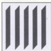
Vertikaljalousien 89 mm, 127 mm