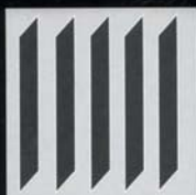
Vertikaljalousien 89 mm, 127 mm