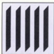
Vertikaljalousien 89 mm, 127 mm